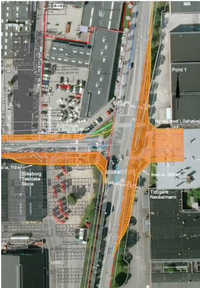
Nyt signalreguleret kryds