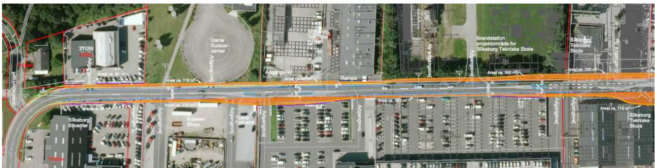
Udvidelse af Bredhøjvej

Vej- og Trafikudvalget godkendte vejforholdene og vejprojektet for Erhvervskorridoren i møde 10. november 2014.