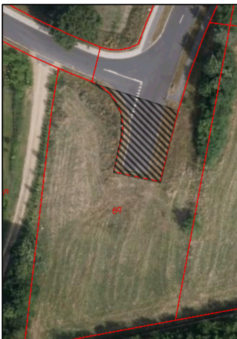
Vejarealet der forudsættes nedlagt vist med sort skravering.

Herunder vises vejarealet der forudsættes nedlagt, samt den fremtidige udstykning med del nr.