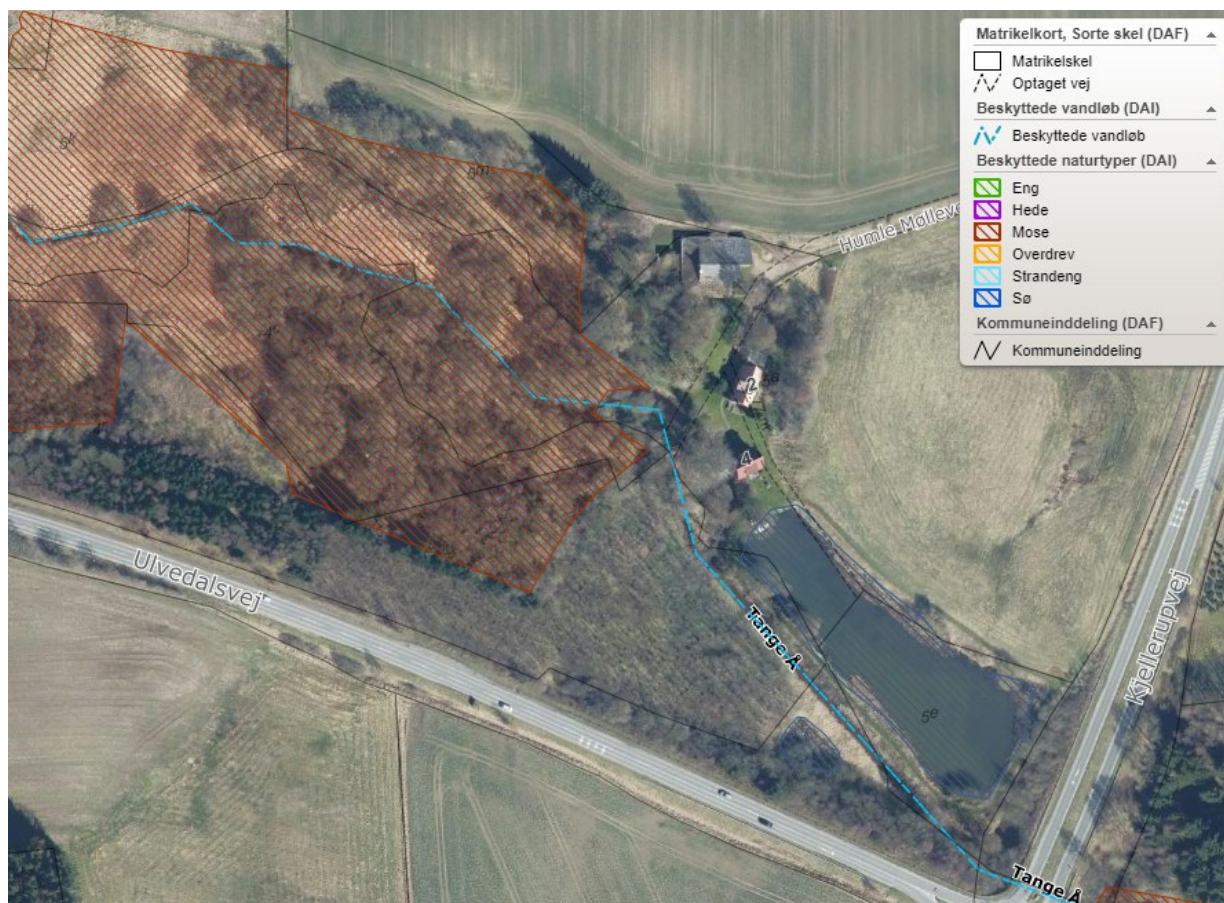
Luftfoto 2023 med angivelse af beskyttet natur ved Humle Mølle

Kort over beskyttet natur mv. i projektområdet: