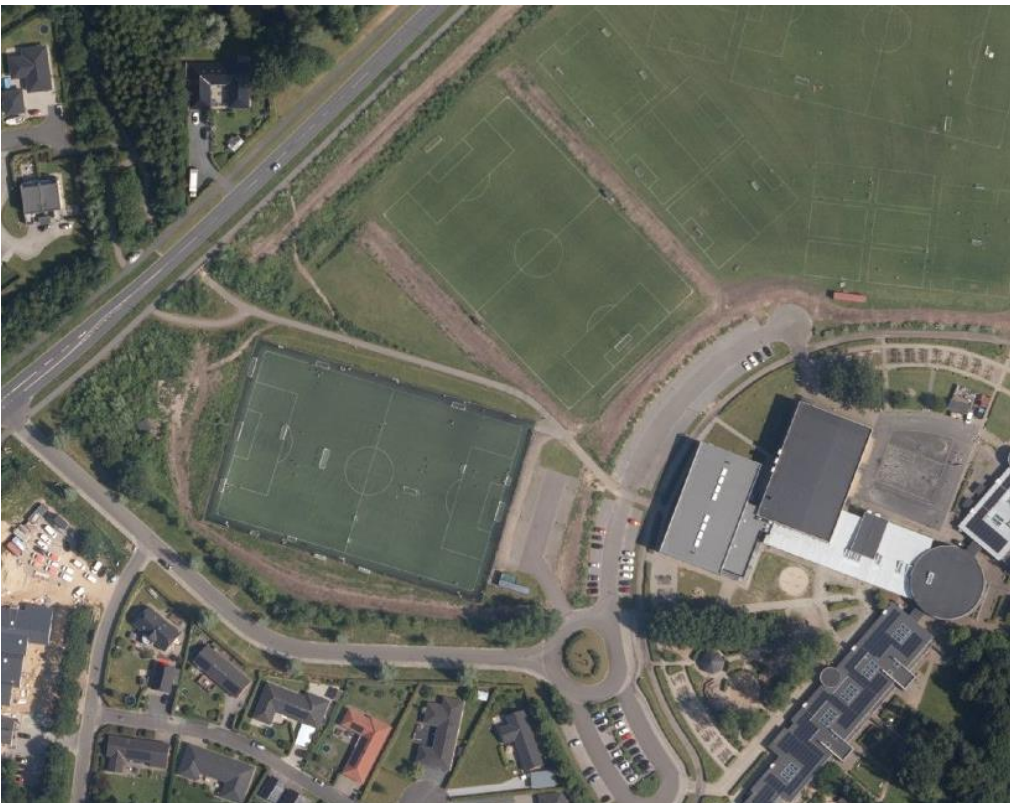
Luftfoto med kunstgræsbanen. Sommer 2024.