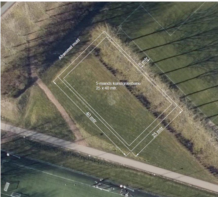
Luftfoto med minikunstgræsbanen indtegnet