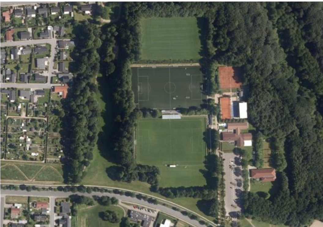
Luftfoto med kunstgræsbanen. Sommer 2024.