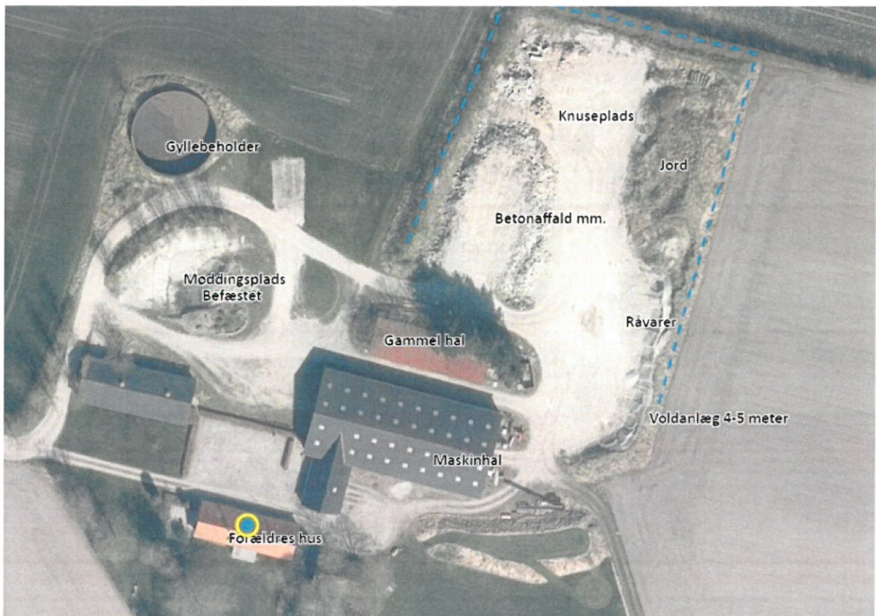
Figur 1 Oversigtskort