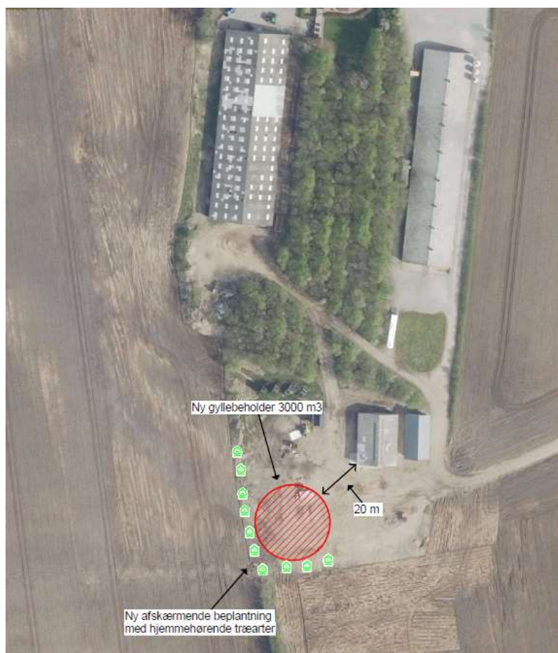
Figur 1. oversigtskort der viser placering af gyllebeholder og afskærmende beplantning.

Der vil blive etableret beplantning mellem beholderen og de omkringliggende marker mod vest og syd.