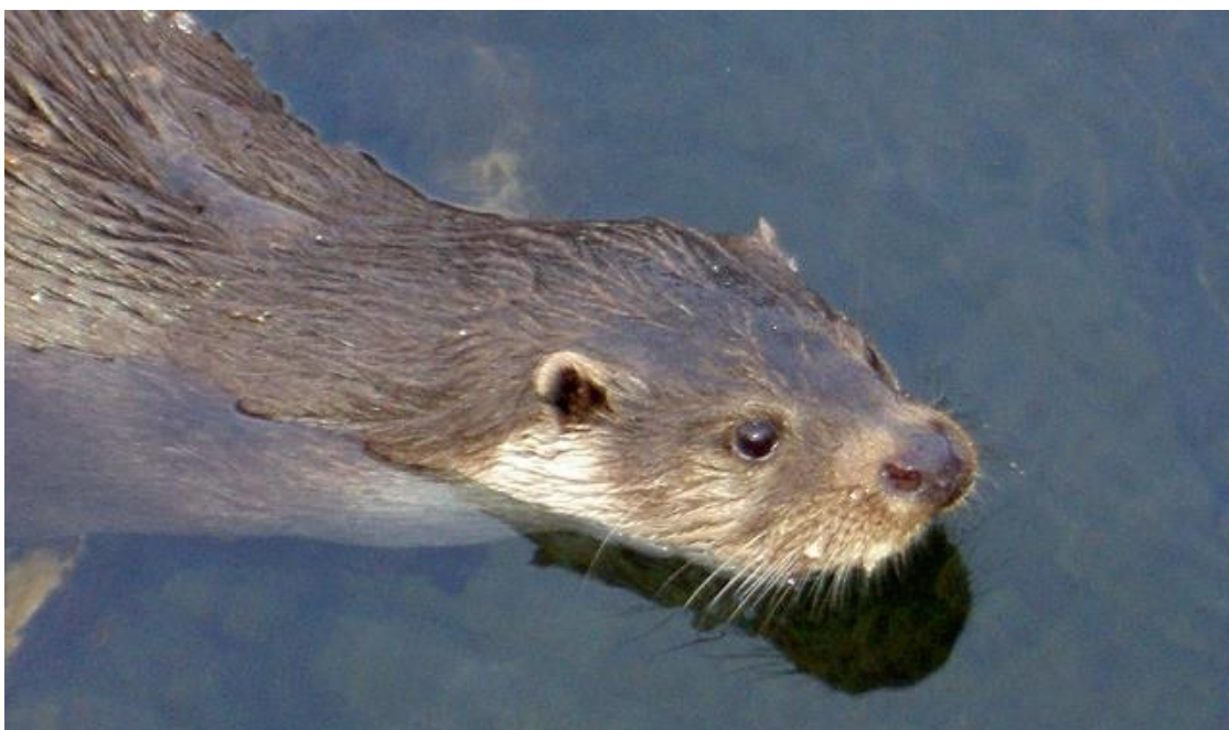
Odder, der er på udpegningsgrundlaget i Natura 2000-området.