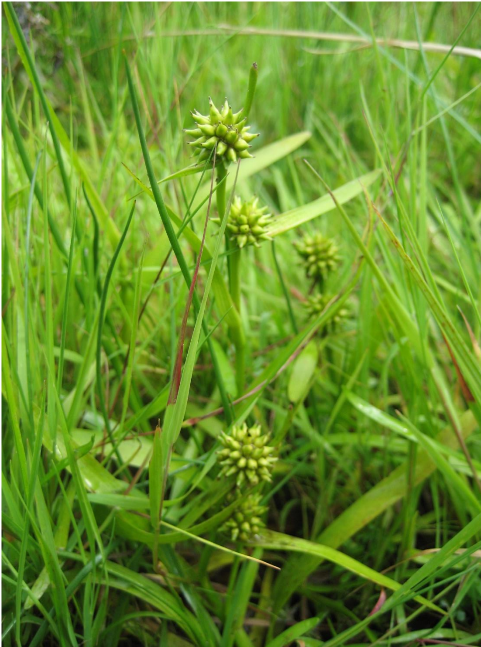
Den relativt sjældne Spæd pindsvineknop i habitatnaturtypen tidvis våd eng indenfor Natura 2000-området.

De fleste indsatser er geografisk bestemt, hvorved den nævnte myndigheds- og arealdeling er gældende. Det er muligt at finde relevante Natura 2000-geodata i MiljøGIS 1 . Endvidere kan overvågningsdata fra NOVANA-programmet tilgås via Danmarks Miljøportal 2 og i Natura 2000-basisanalyserne.