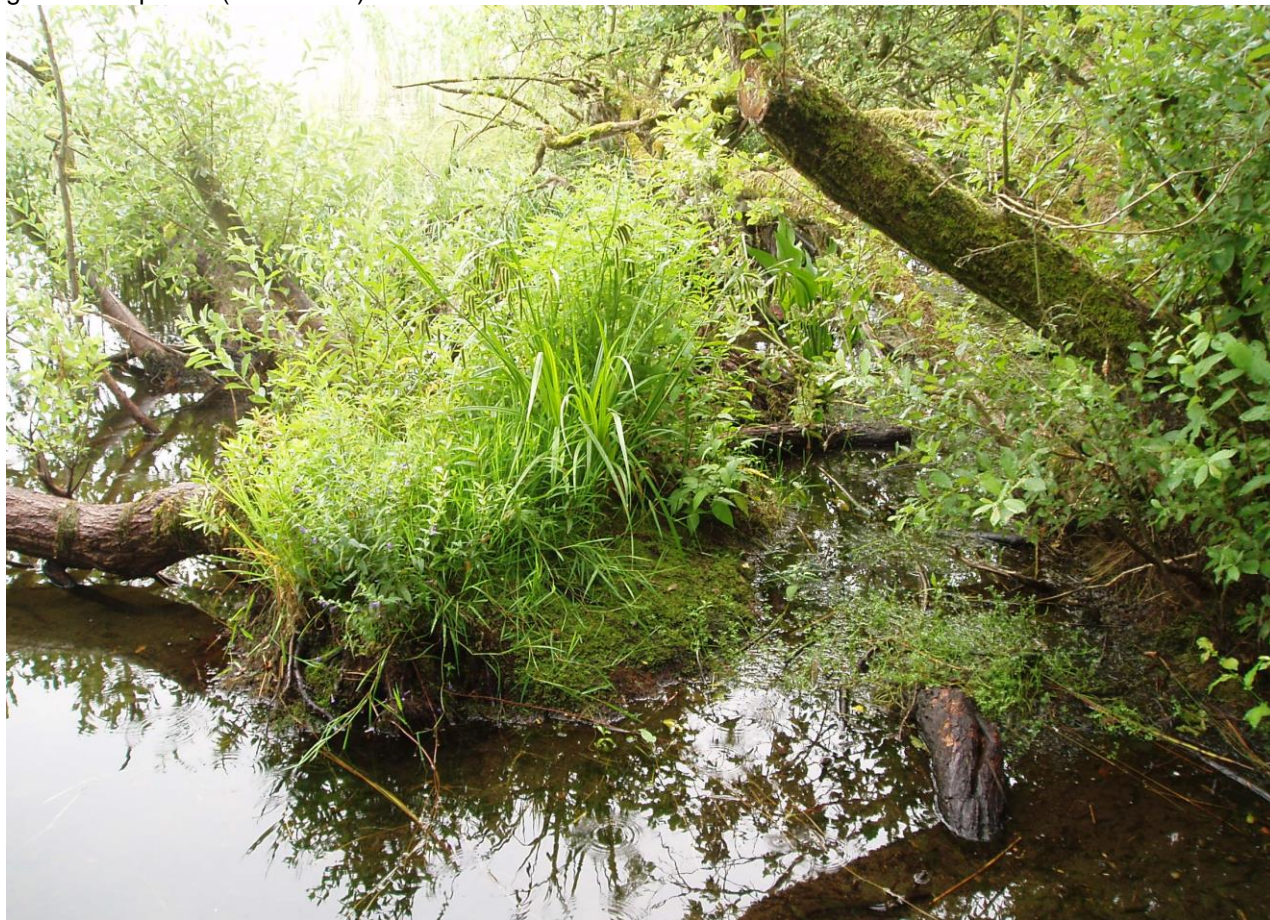
Pilekrat langs bredzonen af Nippgård Sø.

For samtlige Natura 2000-planer er der foretaget en strategisk miljøvurdering (SMV). Natura 2000-planerne og de tilhørende miljøvurderinger kan findes på Miljøstyrelsens hjemmeside under Natura 2000, tredje generation planer (2022-2027).