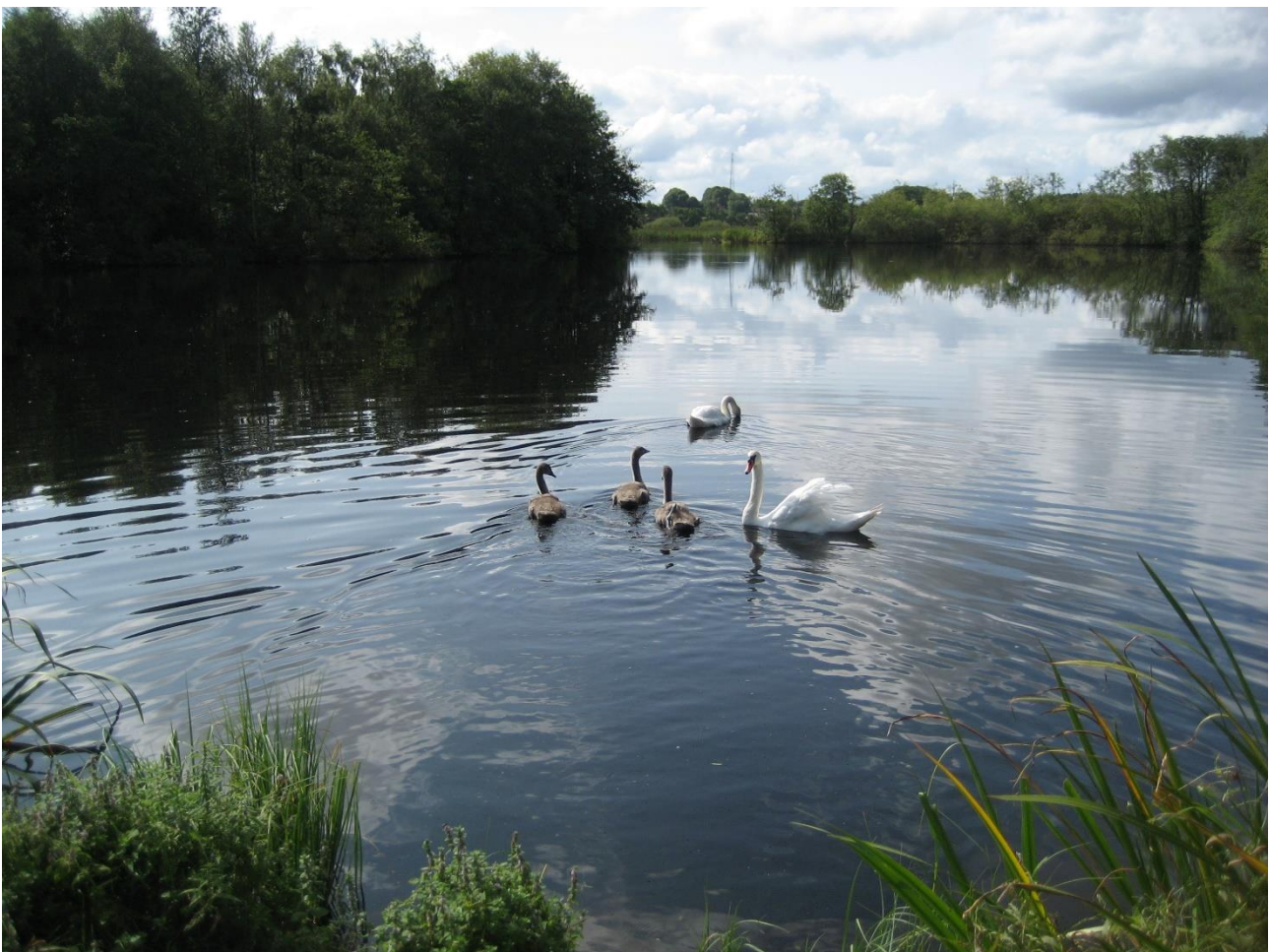
Svaner i Nippgård Sø.

Projekterne gennemføres som udgangspunkt ved frivillige aftaler, og derfor er det i mange tilfælde ikke på nuværende tidspunkt muligt at beskrive hvornår projekterne fysik bliver udført. Kommunen vil i hvert enkelt tilfælde sørge for, at relevante interessenter bliver inddraget.