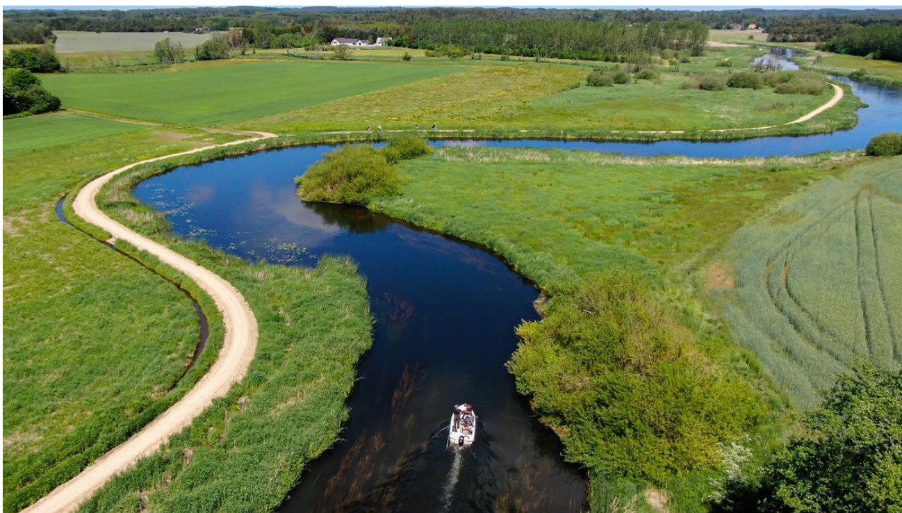
Foto af Gudenåen og Trækstien syd for Kongensbro.

Effekten af indsatserne bliver løbende vurderet i det Nationale Overvågningsprogram for Vandmiljø og Natur (NOVANA), som overvåger vandmiljøets og naturens tilstand inden for de områder, der prioriteres i forhold til de politisk fastsatte økonomiske rammer.