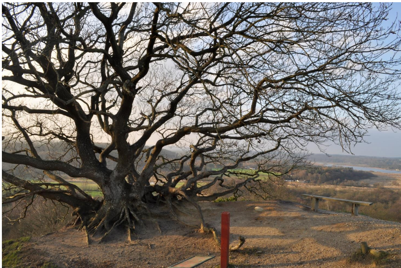
Udsigten fra Store Trolldhøj i Gjærn Bakker.

Lige så vel vurderes synergien mellem Natura 2000- og Vandplanindsatsen at sikre bæklampret og odder gode forhold i habitatområdet.