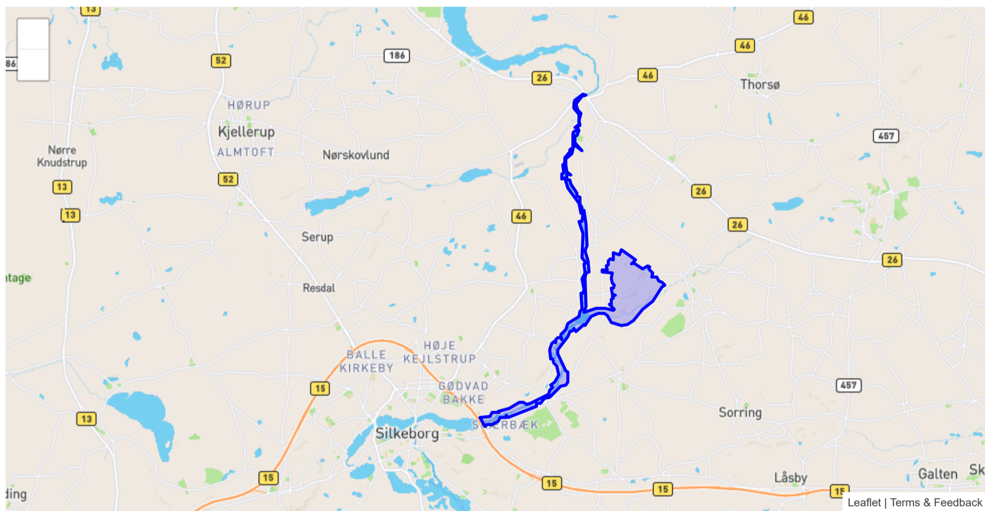
Tabel A: Kortlagte naturtyper på Naturstyrelsens arealer i Natura 2000-området

Natura2000-område N49 har et areal på 834.9 ha. Heraf ejer og forvalter Naturstyrelsen 52.3 ha. I Gudenådalen ejer Naturstyrelsen den historiske træksti og ganske få af de tilstødende engarealer. Omkring Gjern Bakker ejer Naturstyrelsen et samlet areal på ca. 33 ha. Her veksler bevoksningen mellem gammel stævningskov, urørt skov, hede og opgivne marker i forskellig grader af tilgroning fra hede mod egekrat. I heder og egekrat findes en del østlige forekomster af planter, der har deres hovedudbredelses mod vest som f.eks. hønsebær, hedemelbærris og den lave form af gyvel. Omkring Store Troldhøj, hvor der opretholdes et lysåbent hedeareal med spredte birk og ege, er der fundet flere meget sjældne insektarter. Der er påbegyndt en græsning på hedearealet for at undgå, at arealet springer i skov. Desuden er der i udpegningsgrundlaget nævnt følgende arter, der forekommer, eller har potentiale til at kunne indfinde sig, i Naturstyrelsens dele af Natura 2000-området: Stor vandsalamander