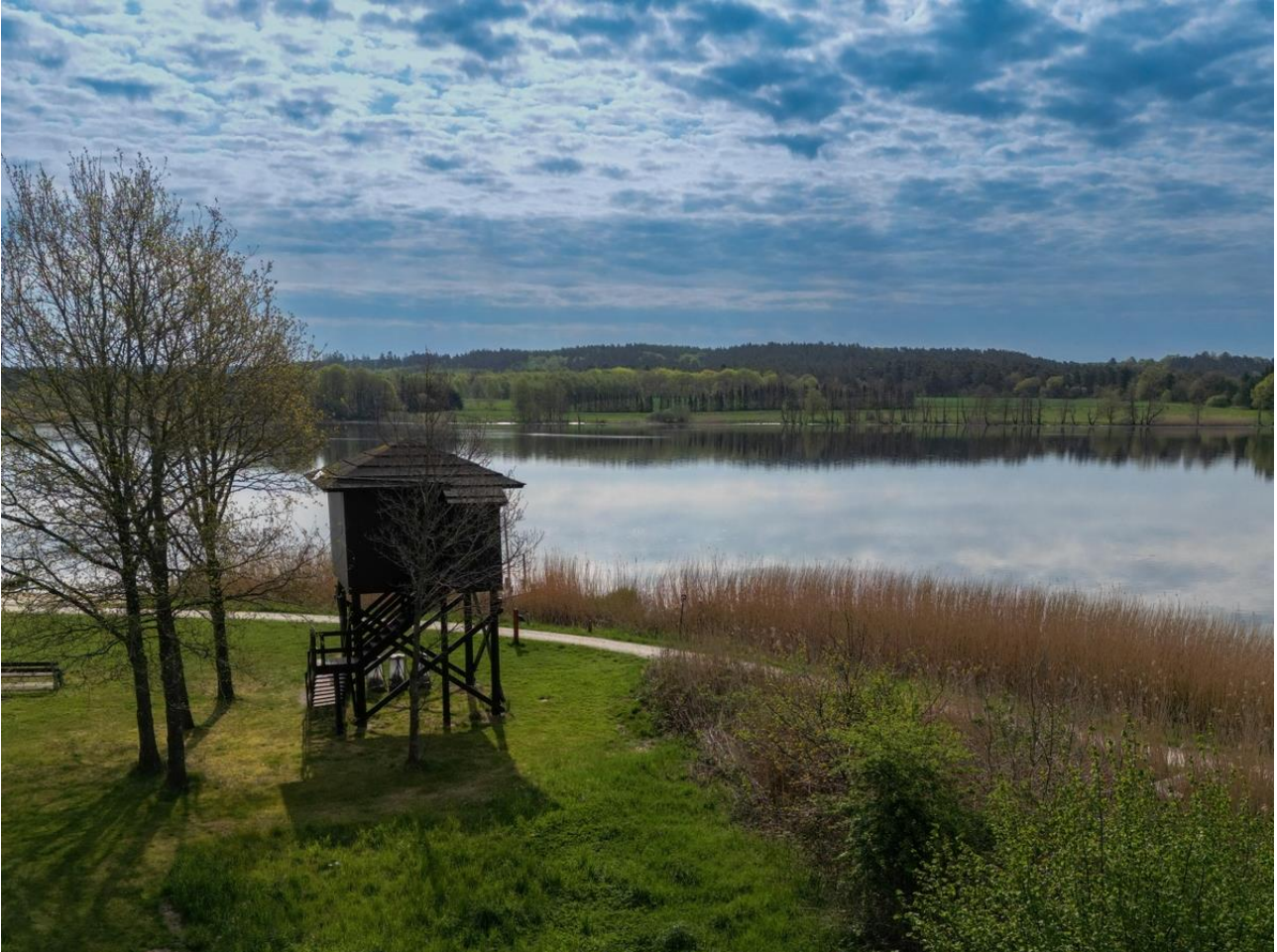
Foto af Sminge Sø med fugletårn og trækstien i forgrunden.

Miljøstyrelsen vil fortsat prioritere at indgå i relevante Life-projekter nye som gamle.