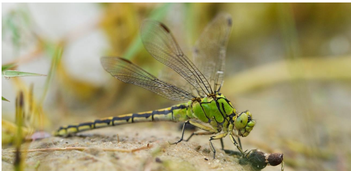
Grøn kølleguldsmed, som er på udpegningsgrundlaget for 2000-området.

For samtlige Natura 2000-planer er der foretaget en strategisk miljøvurdering (SMV). Natura 2000-planerne og de tilhørende miljøvurderinger kan findes på Miljøstyrelsens hjemmeside under Natura 2000, tredje generation planer (2022-2027).