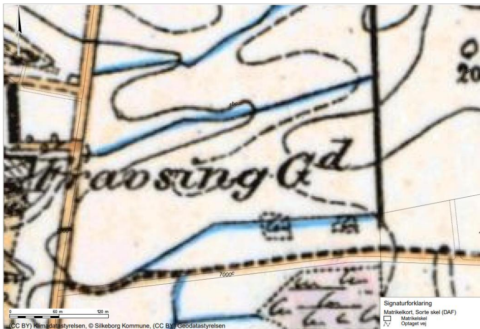
Figur 3: Kort med høje målebordsblade (1842-1899), som viser et vandløb inden for det ansøgte skovrejsningsområde.

Flytning eller fjernelse af dræn eller åbning af rørlagte vandløb kræver tilladelse fra kommunen.