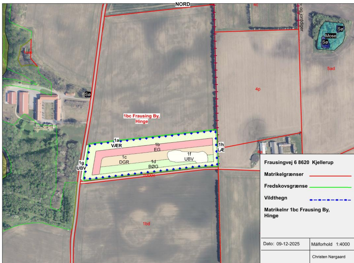
Figur 1: Oversigtskort over det anmeldte skovrejsningsareal.

Omtrentlig placering og omfang af det ansøgte kan ses af oversigtskortet i bilag 1 og på nedenstående kort.