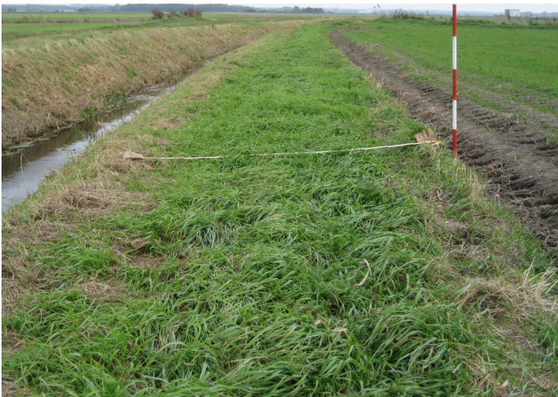
En korrekt udlagt 2 meter dyrkningsfri vandløbsbræmme

Silkeborg Kommune kontrollerer overholdelsen af 2 meter-bræmmen ved stikprøver, i ordinære vandløbstilsyn, under vedligeholdelsesarbejder og ved kontrol med landbrugsejendomme, som udtages til krydsoverensstemmelse. Silkeborg Kommune er forpligtet til at indberette overtrædelser af bræmmebestemmelsen til NaturErhvervstyrelsen, hvilket kan medføre en reduktion af landbrugsstøtten.