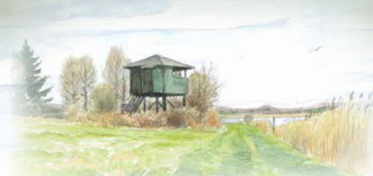
Fugletårn ved Sminge Sø

Går du ca. 300 m mod syd ad Trækstien, kommer du til et fugletårn, hvorfra der er en fin udsigt over Sminge Sø, som rummer et meget rigt fugleliv. På en planche i tårnet kan du læse om, hvilke fugle, der er mulighed for at se og høre. Fra fugletårnet er der en fin udsigt mod øst til Gjærn Bakker og Store Troldhøj på den anden side af Gudenåen.