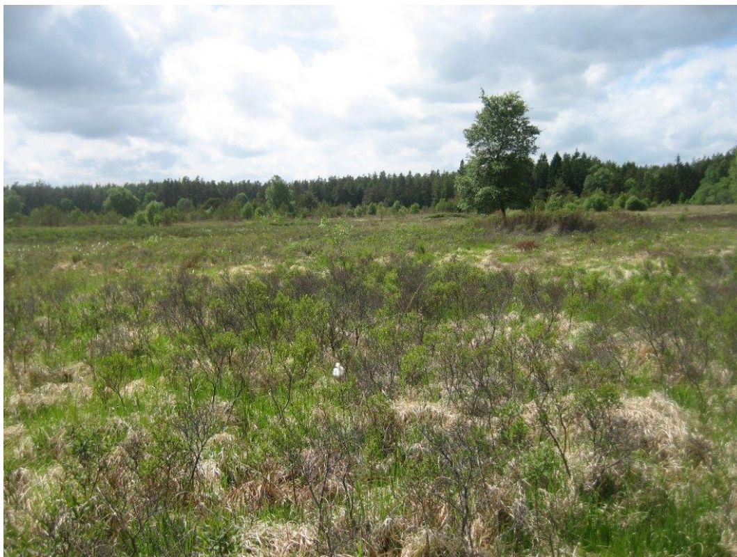
Egedalsmosen i Gjærn Bakker