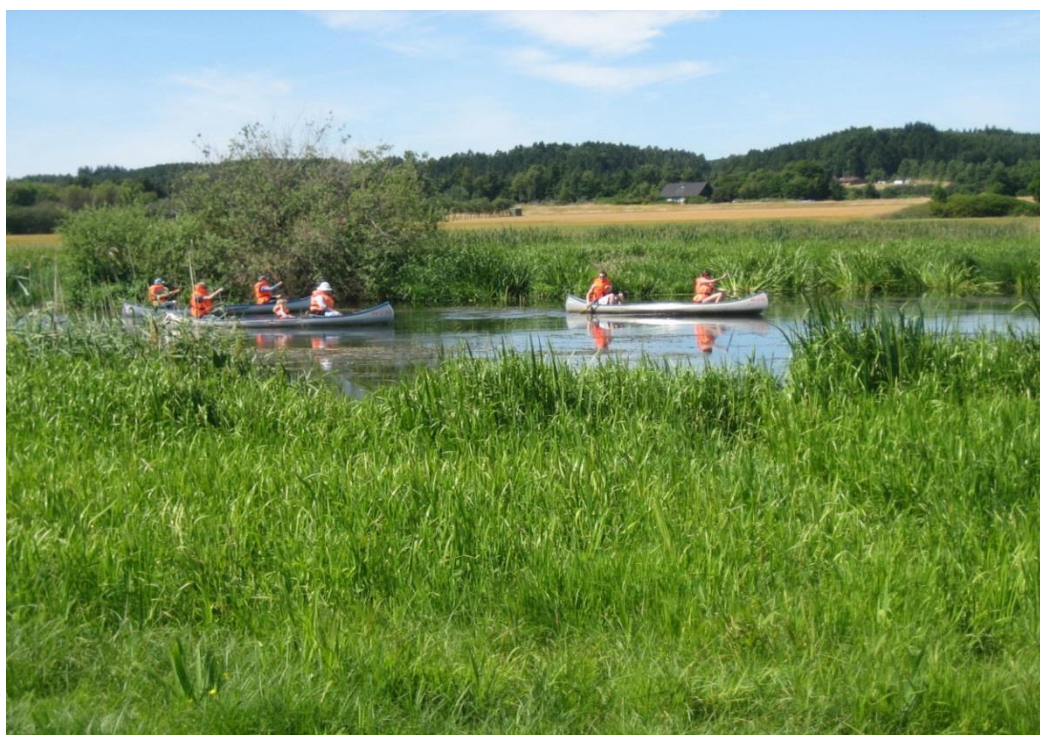
Kanosejlere på Gudenåen

Projekterne gennemføres ved frivillige aftaler, og derfor er det i mange tilfælde ikke på nuværende tidspunkt muligt at beskrive, hvornår projekterne fysik bliver udført. Kommunen vil i hvert enkelt tilfælde sørge for, at relevante interessenter bliver inddraget.