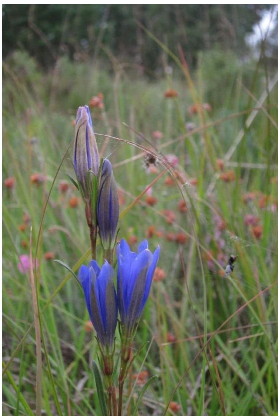
Klokkeensian og klokkelyng i Egedalsmosen