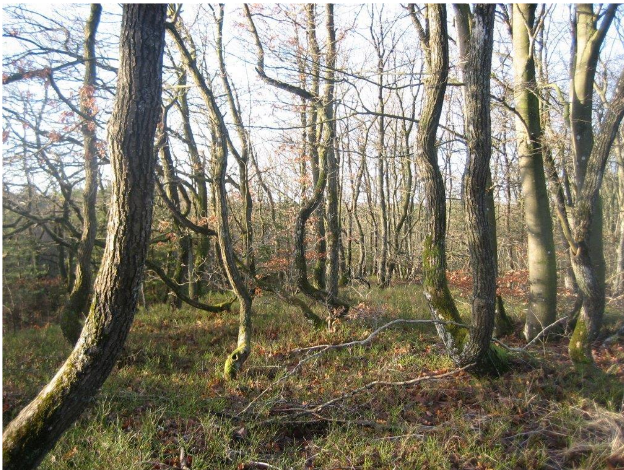
Egekrat i Gjærn Bakker

Det er en fælles opgave for kommuner og offentlige lodsejere at aftale nærmere på hvilke arealer og i hvilke kommuner, den konkrete indsats skal foregå.