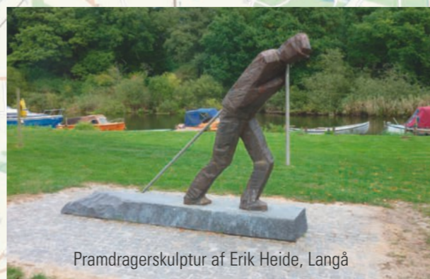
Pramdragerskulptur af Erik Heide, Langå

7 Gudenåcentralen. Danmarks største vandkraftværk etableret i 1920. Hele anlægget med den kunstige Tange Sø udgør en velbevaret helhed. Historien fortæller på Energimuseet ved siden af. Gudenåcentralen. Denmark's largest hydro power plant was established in 1920. The entire facility along with the artificial Tange Lake constitute a well-preserved unity. The story is told at the Energy Museum next door.