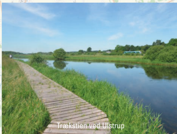
Trækstien ved Ulstrup

6 Kjællinghø. Imponerende træbro over Gudenå - Danmarks største bro i rundtømmer. Kjællinghø. Impressive wooden bridge crossing the Gudenå – Denmark's largest bridge built with roundwood.