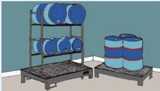
Figur 1: Eksempel på indendørs opbevaring

Silkeborg Kommune kan, efter miljøbeskyttelseslovens § 42, stk. 1 - 4, stille krav om yderligere forureningsbegrænsende tiltag eller forbud mod et oplag.