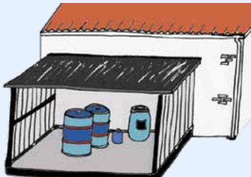
Figur 3: Udendørs opbevaring under tag med tæt bund og opkant.