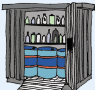
Figur 2: Udendørs opbevaring i container med dobbelt bund.